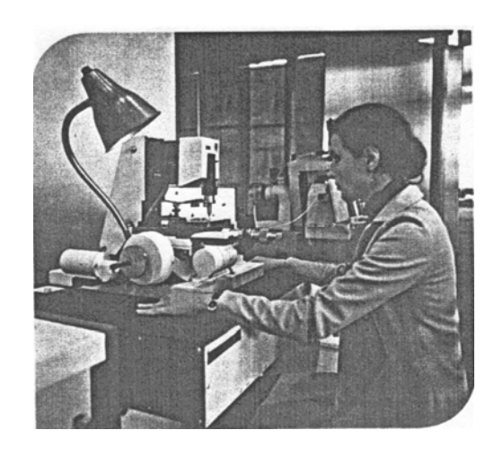
Рис. 3. Станок для локального электроискрого нанесения ЕЛФА 541

Технология реализована на практике при помощи серийно производимых станков типа ЕЛФА. Это станки с полуавтоматичным управлением приводом координатного стола (Елфа 512, Елфа 541) и с цифровым программным управлением (Елфа 731).